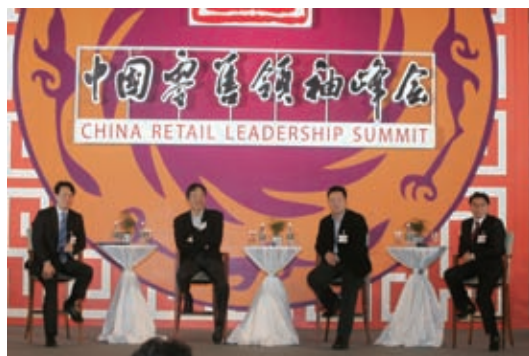
2013 中国零售领袖峰会 - 观点互动

“第 15 届中国特许加盟大会”，以转变增长方式为主线，提出“细分化渗透市场，标准化提升效率”的大会主题，集中展示了过去一年特许经营领域的创新案例，分享连锁各业态优秀品牌的最佳实践，800 余名业内人士参加会议。