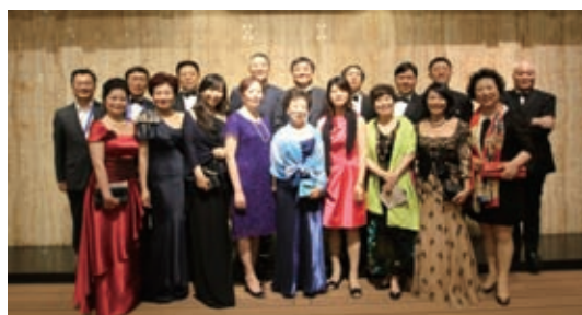
代表团参加世界消费品论坛 2013 全球峰会