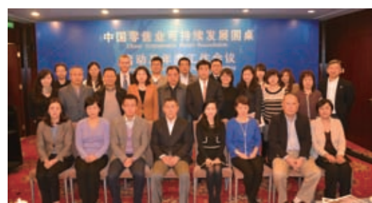
中国零售业可持续发展圆桌启动及年度工作会议