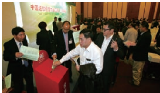
四届二次理事会选举投票

协会四届二次理事会在成都召开。共 146 位理事代表出席了会议。会议审议并表决通过了《中国连锁经营协会四届二次理事会工作报告》以及各专业委员会工作报告，选举并增补副会长 3 名、常务理事 5 名、理事 13 名。