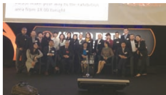
代表团在 2013 年世界零售业大会上