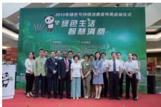
2013 绿色可持续消费宣传周启动仪式

Push forward Retail Sustainability & Carry out Social Responsibilities