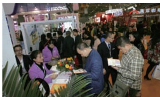
2013 中国（成都）特许加盟展览会现场

成都站是继中国特许展在北京站、上海站之后，首次在成都举办，展览会吸引了近百家特许企业参展，展出面积达到 7000 平方米，专业观众 5000 多人。