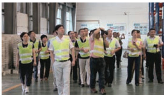
便利店委员会委员参观十足便利物流中心

在不断改进《连锁》杂志质量的同时，协会还开通了微信公众账号，与《连锁》杂志和协会网站的内容形成互动。