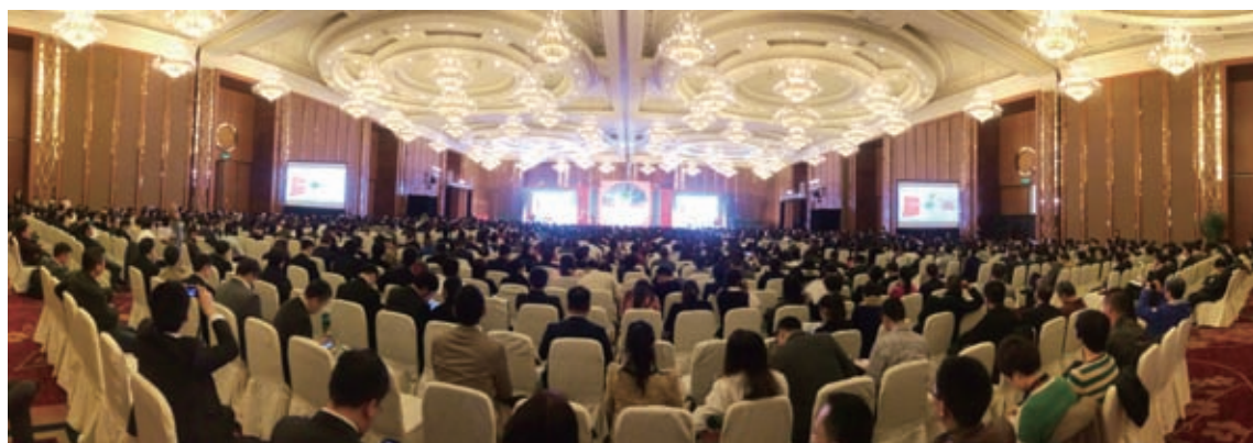
第十五届中国连锁业会议