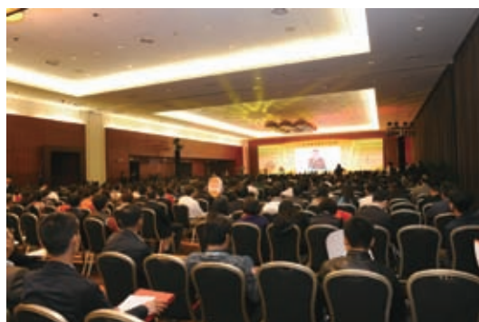
第 15 届中国特许加盟大会主会场