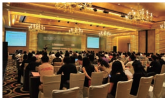
第 9 届 CCFA 食品安全年会