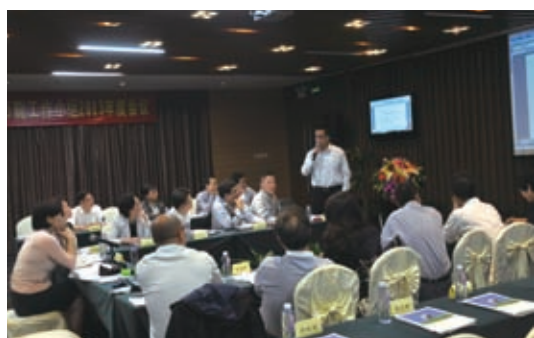
协会零售节能工作小组 2013 年度会议现场