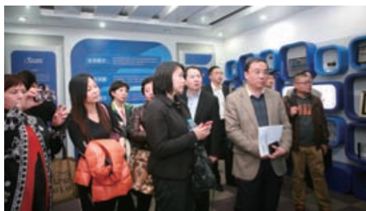
特许经营委员会参观北大青鸟总部

协会共有 16 个专业委员会，还成立有零售业可持续发展圆桌、校企合作工作小组、零售节能工作小组。委员会的高效组织和运转，保证了协会的各项活动能够紧贴行业和会员发展需要。