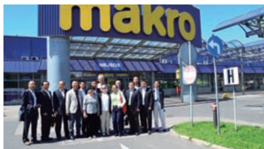
便利店委员会考察麦德龙 Makro

围绕委员会需求组织境外考察，今年先后组织物流委员会欧洲考察团、便利店委员会东欧考察团、防损委员会美国考察团、特许经营委员会南美考察团。参观学习了欧美日发达国家物流、便利店、防损等方面的先进技术和经验。