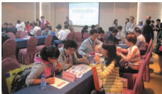
采购委员会参加 2013 义乌小商品博览会

会员发展的重点依然是行业和区域领先企业，特别是新兴行业和业态的龙头企业。截至 2013 年 11 月，协会拥有会员 1015 家，其中，零售业会员占 41.3%，餐饮与服务会员占 20%，供应商、服务商会员占 22%，咨询机构会员占 6%，其他占 10.7%。协会引进客户关系管理（CRM）系统，进一步提高服务专员工作效率，优化会员发展与服务流程。