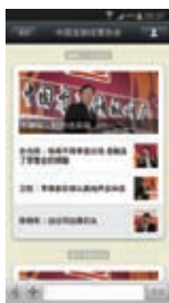
通过微信平台发布零售领袖峰会观点