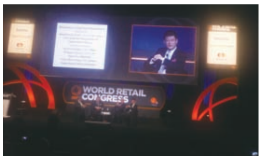
银泰集团总裁在世界零售业大会上演讲