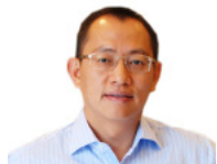
洪杰 华润万家有限公司 首席执行官