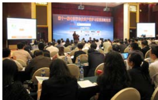
第 11 届中国零售业资产保护与防损高峰论坛

第 8 届中国连锁企业人力资源高峰论坛，就有效提高人效、应对多渠道销售给传统零售行业带来挑战进行专题讨论。会议还安排了校企合作、绩效福利和多元化用工等三个分会场。