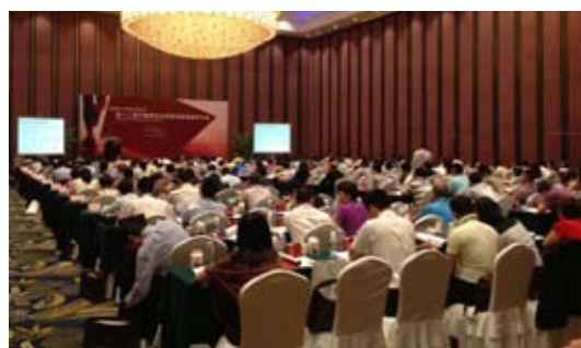
第 12 届餐饮业连锁发展战略讨论会