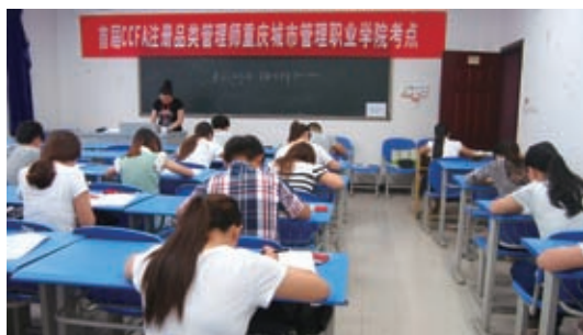
CCFA 注册品类管理师（助理级）全国统考现场