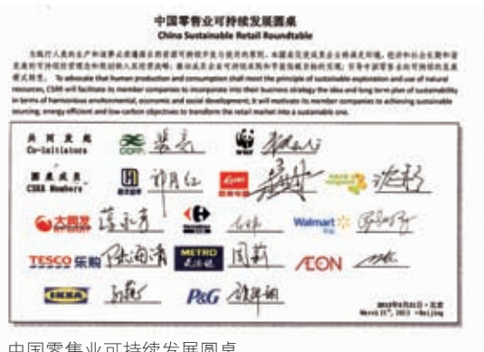
中国零售业可持续发展圆桌

协会与世界自然基金会（WWF）共同发起“中国零售业可持续发展圆桌”，3月在京召开成立会议，圆桌成立后，在北京、上海、广州、深圳等地开展绿色消费宣传周活动，并得到商务部的支持，取得良好的社会反响。