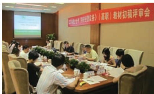
连锁系列教材《特许经营实务》编审会