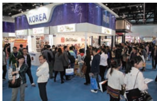
第 15 届中国特许加盟展览会现场

本届展览会展出面积达 2 万平方米，共有 290 多家企业，近 400 个特许品牌参展，吸引专业观众 2 万多人。展览规模创 15 年来的新纪录，成为亚洲最大的特许加盟展。