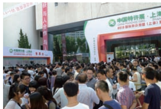
第 10 届国际特许加盟（上海）展览会现场

展会吸引了包括韩国、台湾展团的 200 多家公司参展，展出面积 12000 平方米，专业观众 1 万多名，是自 2004 年创立以来规模最大的一次。