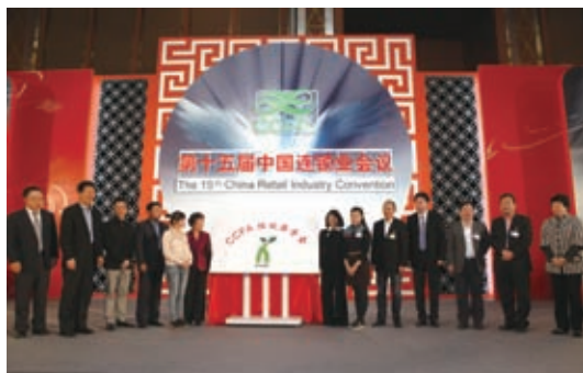
CCFA 恒欣奖学金启动仪式