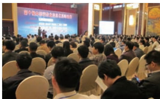
第 10 届中国零售业信息化峰会