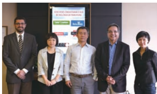
协会与巴西特许经营协会达成合作意向