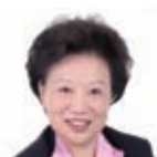
郭戈平 中国连锁经营协会会长