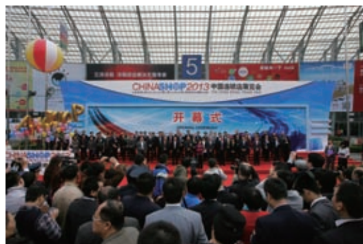
第十五届中国连锁店展览会开幕式

展会设置零售、商用设施设备、IT 技术设备、特色商品、商业地产、全程冷链、移动支付技术、全渠道商店八大综合展示区。展出面积 60000 平方米，折合 2200 多个国际标准展位，是位列世界第二的商店用品展。三天共吸引专业观众 19000 多名，其中专业买手占观众总量的 43%，中国连锁百强、快速消费品百强、协会沙龙所属企业派出近 2000 名专业买手现场洽谈采购。