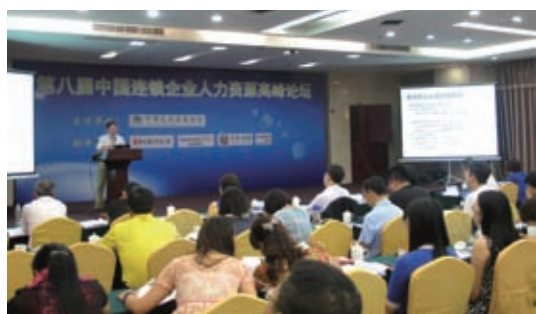
第 8 届中国连锁企业人力资源高峰论坛